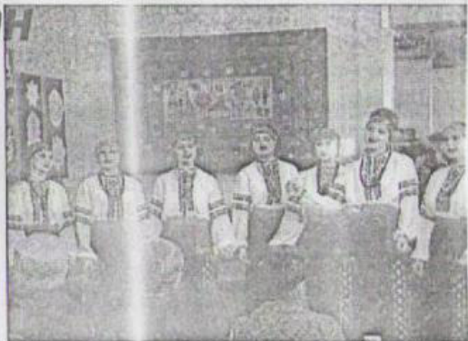
Выступает народный вокальный ансамбль «Краплина» Донецкого училища культуры.

С. ПЛАТОНЕНКО.